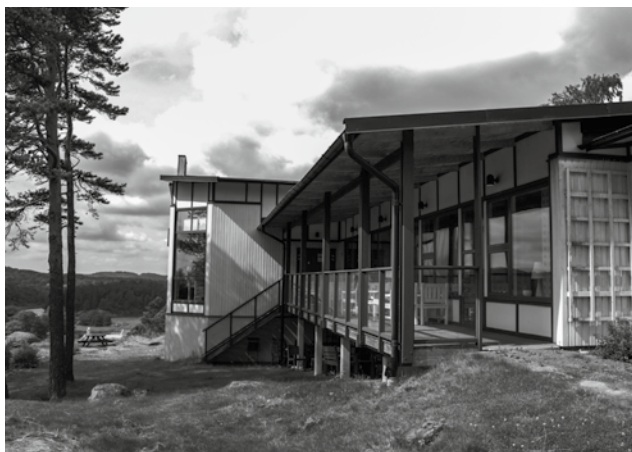
2017 års Mimerkonferens genomförs på Nordiska folkhögskolan i Kungälv

VÄLKOMNA till Mimers årliga forskarkonferens den 7-8 november 2017 som i år arrangeras i samarbete med Utbildningsvetenskapliga fakulteten vid Göteborgs universitet och Nordiska folkhögskolan i Kungälv. Vid konferensen uppmärksammas särskilt relationen mellan musik och bildning. Såväl innanför som utanför den institutionaliserade folkbildningen har musikskapande och